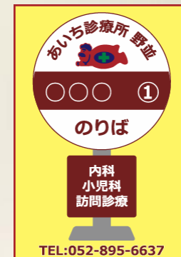
壁等に掲げるパネル