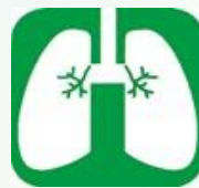
肺がん・結核検診