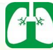
肺がん・結核検診