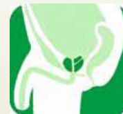
前立腺がん検診 (男性のみ)